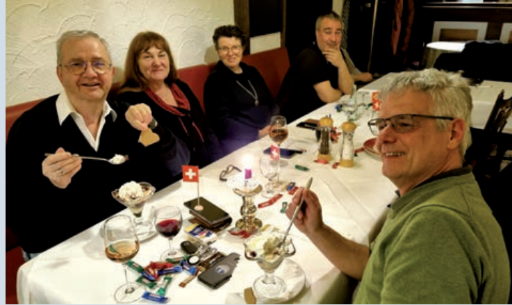
Eine Glace rundet das Mahl bei den Landsleuten im Ruhrpott ab.

Dürfen wir vorstellen: Der Schweizer Verein für Essen (Ruhr)